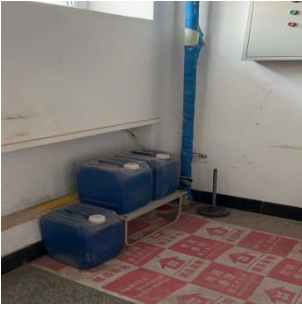
逸夫实验楼3楼走廊