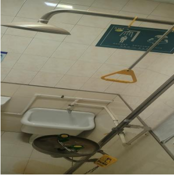
逸夫教学楼喷淋间