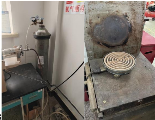
大学生实训中心一层