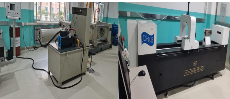
高性能机械传动与装备实验室